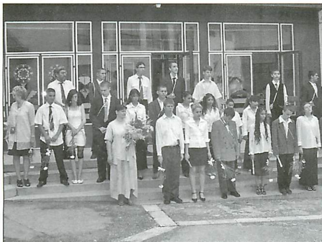
A ballagás azt is jelenti, hogy megkezdődött a vakáció, amely veszélyeket is rejt magában

Az elmúlt hét végén Ózd tíz általános iskolájában ballagtak a végzősök, ami azt is jelenti, hogy megkezdődött a nyári szünet. Am a vakáció a pihenés, önfeledt szórakozás mellett veszélyeket is rejt magában. Ebben az időszakban rendkívül megnő a gyermekbalesetek száma, amelyek többsége egy kis odafigyeléssel elkerülhető lenne.