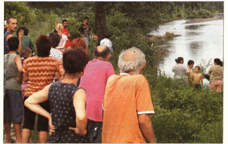
A falu apraja és nagyja a folyóparton várakozott

http://forum.boon.hu Írja meg a véleményét!