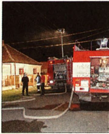
Gyorsan újták álltáka lángoknak

Bodrogkeresztúr (ÉM - PT) Szolgálatba induló, civiliben lévő rendőr fogta meg a tolvajportyán járó csapatot. – A vendégház lakóját lopták meg Bodrogkeresztúron a minapi éjjelen, ugyanis a turisták biztonságban érezték magukat, és nem zárták kulcsra szobájukat. A vendég a motorkézlásra felébredt, és még látta elmenekülni a négy alakot, jó személyleírást adott a rendőröknek. A véletlen pedig besegített, egy rendőr azon a vonaton utazott szolgálatba. Mobilon értesítették és civil ruhás zsarú meglepte a csapatot.