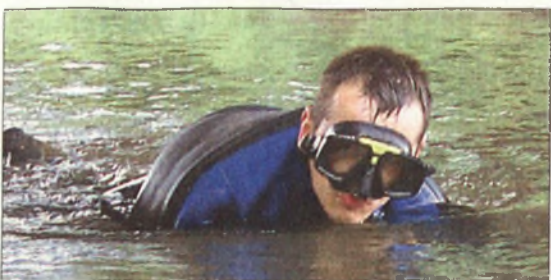
Búvárok találták meg a halott fiatalembert

Most két fiú és egy lány strandolt a tóban, amikor huszonhat esztendősrű társuk is vetkőzni kezdett, hogy megmártózzon. A többiek azonnal rászóltak, ugyanúgy, mint azt Nyékládházánál tették a barátok: ne menjen a vízbe, mert nem tud úszni. A fiatalember azonban nem fogadta meg az intelmeket. A vízbe ugrott, és pillanatokkal később elmerült. Az imént még intelmeket adók azonban résen voltak. Előbb még sikerült elkapniuk bajba jutott társukat. A hirtelen sokkhatás miatt azonban az úszni nem tudó fiatalember annyira kapálódzott és csapkodott, hogy kicsúszott segítőitársai keze közül. A segélykérés után a kazincbarcikai tűzoltók, a rendőrök, a mentőszolgálat emberei vonultak a helyszínre. A Spider Miskolci Speciális Mentőcsoportot is riasztották, akik búvárok közreműködésével emelték ki a szerencsétlenül járt fiatalember holttestét. Közvetlen a part mellett hat-hét méter mély a tó vize. Itt, a mederfenéken feküdt az áldozat. Segíteni rajta azonban már nem lehetett. A halottszemle során idegenkezűsége, bűncselekményre utaló adat és körülmény nem vetődött fel. Ezért a Kazincbarcikai Rendőrkapitányság közgazdasági eljárásban vizsgálja a tragédia körülményeit. A halál bekövetkezésének okát pedig az igazságügyi szakértői boncolás során állapítják meg.