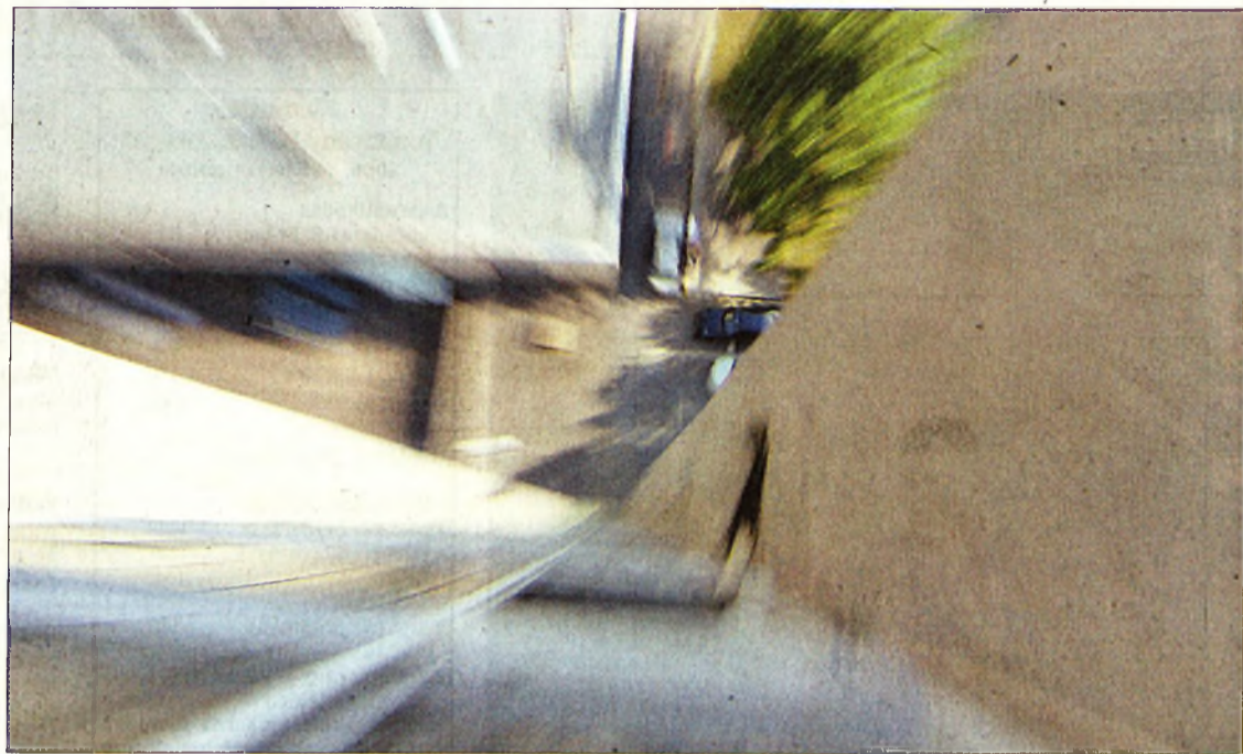
Elgondolkodtató, hogy mi vonzza ide az életunt fiatalokat

Az őrnagy szerint van egy divatirányzat, az „emo” jelenség, talán életstílus, ami fekete ruházatban, fekete színűre festett hajban, feketére lakozott körömben nyilvánul meg. Ennek azonban nem feltétlenül van köze az úgynevezett sátánizmushoz. Az ilyen