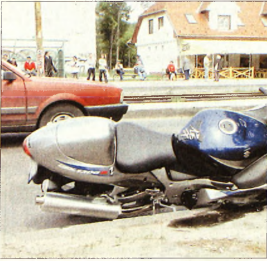
További baleseti videók és képsorozatok

● Disztárcsák gazdára várnak. Disztárcsa-tolvajokat fűleltek le a rendőrök a napokban Miskolcon. Gyári tárcsákat lopnak az elkövetők, akiket megfogtak. A Vasgyári Rendőrőrsön megtekinthető a zsákmányolt holmi. Aki igazolni tudja, hogy közte van a sajátja, visszakapja a keréktartozékot.