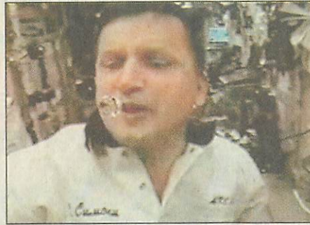
Így vadászik elszabadult vízcseppe