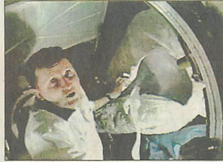
Falhoz szíjazott hálósákban alszik

MAGYARORSZÁG-NEMZETKÖZI ŰRÁLLOMÁS – Bár Charles Simonyi (58) leggyakrabban űrturistaként emlegetik, utazása során mégis jóval több kényelmetlenséggel találkozott, mint egy egyszerű kiránduláson. A súlytalanságban még a leghétköznapibb dolgok is jóval nehezebbek, mint a Földön. Simonyi rövid videós üzeneteiben be is mutatta mindezt