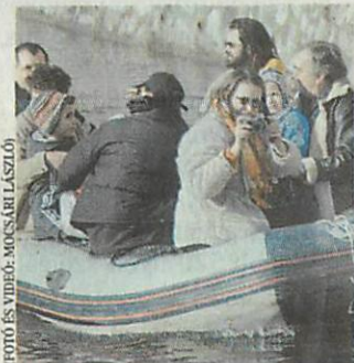
Élesben majd február harmadik hétvégéjén