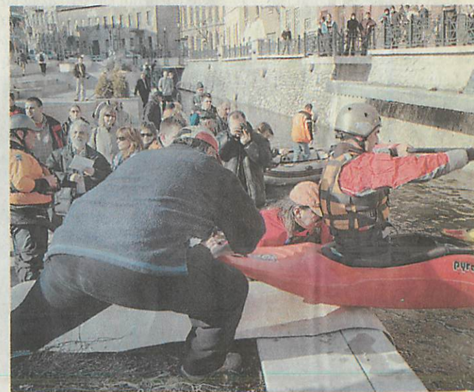
A vízre bocsátás pillanatán