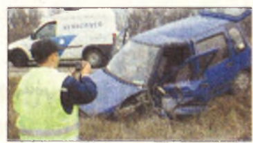
A helyszínen

Miskolc (ÉM) – Nagy anyagi kárral járó, személyi sérülést nem követelő közlekedési baleset történt Miskolc és Szirmabesenyő között a repülőtér mögötti úton vasárnap délután. Az első információink szerint egy Daewoo erintőlegesen nekihajtott a vele szemben jövő Renault-nak, majd egy Opel Astrának ütközött félfrontálisan. Mindkét autó az árokban kötött ki.