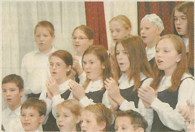
A kis Fazekas Kórus

Ezt bizonyítja a japán felkérés is, melynek keretében a kórusból 35 főt teljes ellátással meghívtak az ötévente megrendezett kórus-világfesztiválra. A szervezés folyamatban van, mindent el fognak követni, hogy összejöjjen a szükséges forrás, és Japánban is tovább öregbítsék a Fazekas és Magyarország énekművészetének hírnevét.