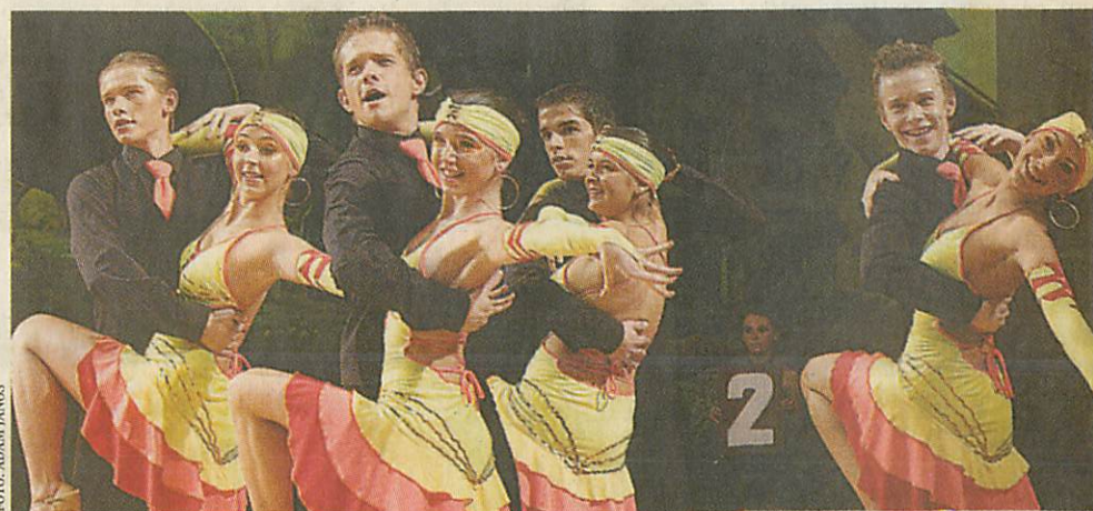
32. FORMÁCIÓS TÁNCFESZTIVÁL. Későn este ért véget a Városi Sportközpontban a 32. Formációs Táncfesztivál. A hazai vezető csoportokon kívül számos külföldi együttes is táncparkettre lépett, köztük a világbajnok moldáv csapat.