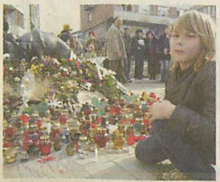
Virágok és mécsesek

odafigyeléssel. Mancs jelképpé vált a város számára - fejtette ki az alpolgármester - a hűség és odaadás, az életmentés jelképévé.