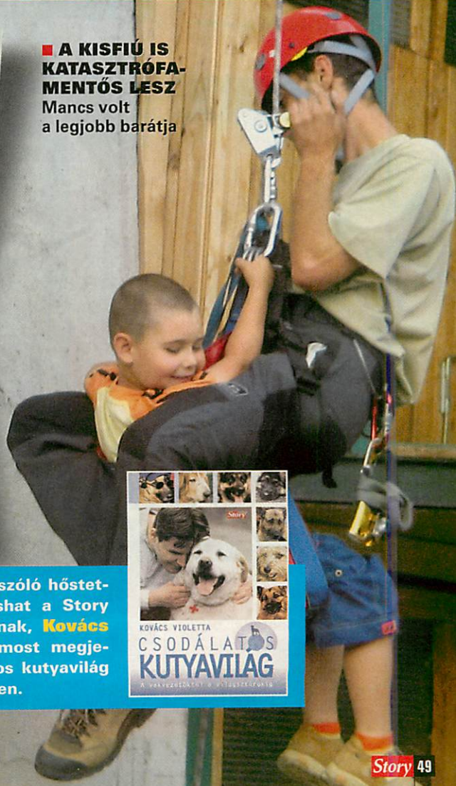
■ A KISFIÚ IS KATASZTRÓFA-MENTŐS LESZ Mancs volt a legjobb barátja