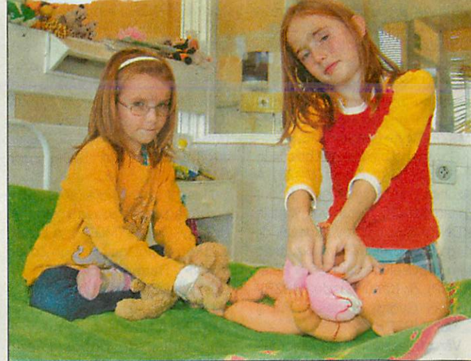
Három évtizede a kis betegekért.