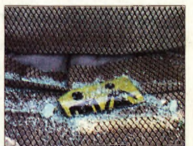
A sérült járműben

új iskolabuszral oldják meg a hegyaljai gyerekek Sárospatakra szállítását – tette hozzá Vojnár László.