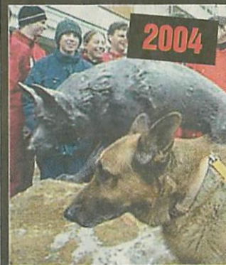
Mancs részt vett saját szobrának felavatásán Miskolcon

A kutya nyugdíjaskorában, betegen sem hagyott fel hivatásával, igaz, csak autóban és csónakban dolgozott, mert a két hátsó lábába gyenge volt, ezért gazdája segített neki a ki- és beszállásban. Szimata az utolsó napig csalahatatlant volt, akár a hét méter mély víz alján levő holttest szagát is megérezte. A legendás keresőkutyának még életében szobrot emeltek 2004 szeptemberében Miskolc belvárosában.