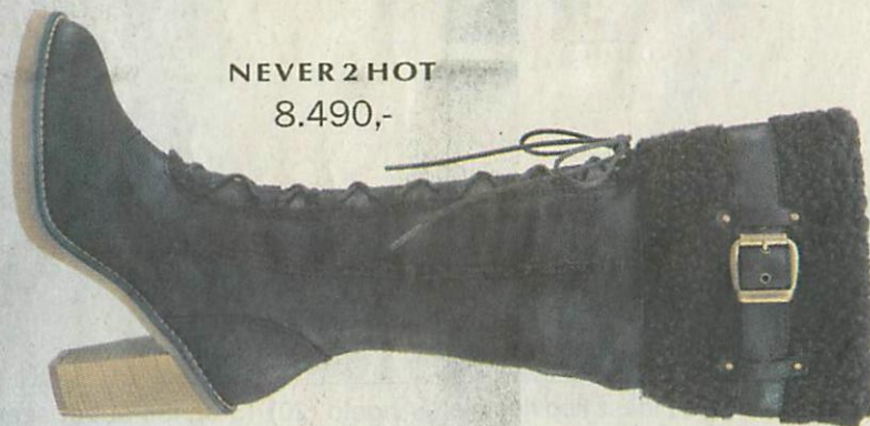
NEVER 2 HOT 8.490,-