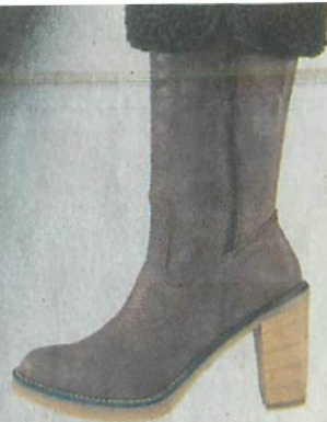
NEVER 2 HOT 8.490,-