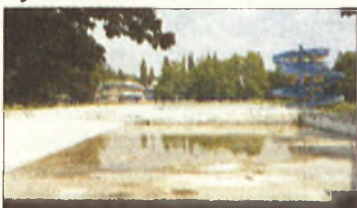
Tapolcai nyár 2006

Miskolc (ÉM) – Olvasóink kérdezi: miért nem nyitott ki az idén nyáron a tapolcai strand? Hiszen a tervezett építkezés sehol, igazán kihasználhatnák még a strandot a nyáron.