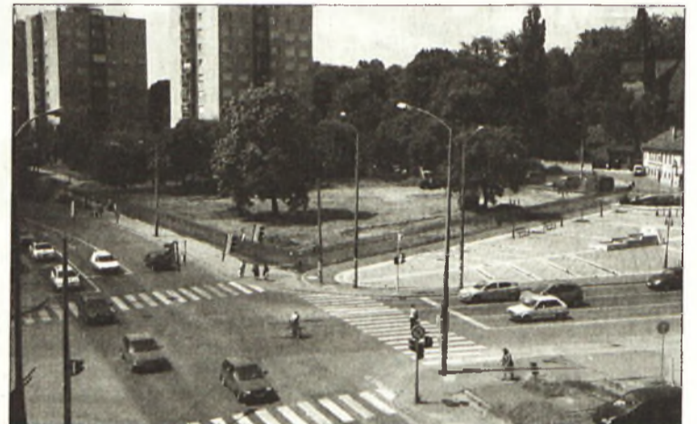
A zöldterület helyén lesz a park

– A park nem más, mint a templom előtti zöldterület továbbfejlesztése – folytatta Dobos Sára. – Egy díztér, egy pihenőtér, ahol például a templomban köttetett esküvők