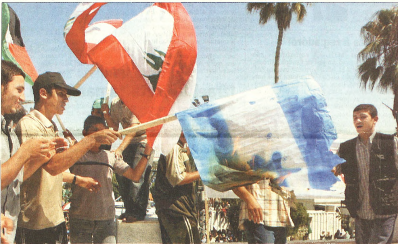
Nem csitul az ellenséges hangulat a libanoni fiatalok körében