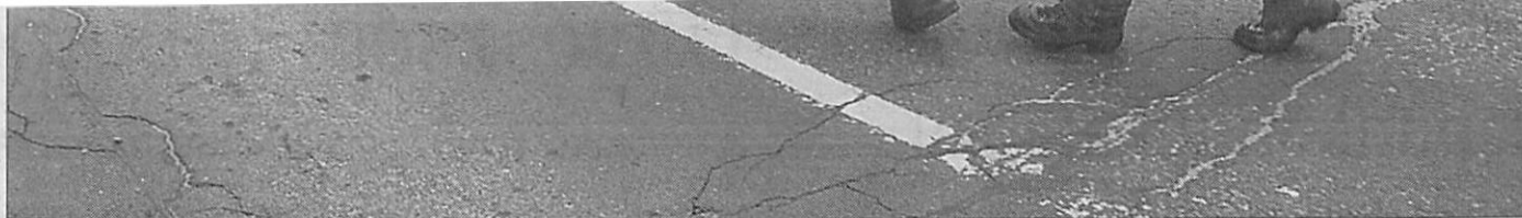
Egyértelmű a helyzet: rendőrök támadnak a munkáját végző fotóriporterre

A viszonylagos nyugalom időszaka után a palesztinokkal vívott összecsapások újabb heves sorozatára számít az izraeli hadsereg – közölték tegnap magas rangú biztonsági tisztségviselők. A sötét előrejelzés a hadsereg 2006 és 2011 közötti időszakot átfogó, ötéves felkészülési tervén alapul, amelyet júliusban hoznak nyilvánosságra. A feszültséget jelzi, hogy a bérik megígért kifizetésének elmaradása miatt tiltakozó palesztin köztisztviselők tegnap megrohanták a pénzintézet központi kirendeltségét, fegyveresek pedig egy palesztin tv-állomás székházában törtek zúztak. A palesztin hivatalnokok utoljára márciusban kaptak fizetést, igaz, egy palesztin bank tegnap elkezdte folyósítani a közalkalmazottak egy részének egyhavi bérét. (MTI)