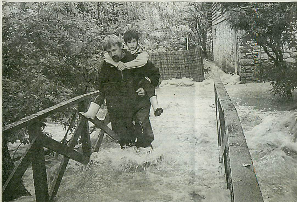
Több utcát, épületet is elöntött a Garadna-patak Lillafüreden

A Miskolc melletti Garadna- és Szinva-patakon ugyancsak rég nem tapasztalt árhullám vonult le. Rétközi Ferenc ezredes, az OKF megyei igazgatója szerint, bár jelentős anyagi károk keletkeztek a két helyi patak áradása nyomán, az időben elkezdett védekezés eredményesnek bizonyult. Több száz homokzsákot helyeztek el a borsodi megyeszékhely érintett, felső-há-