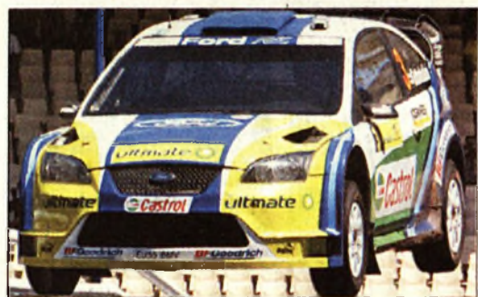
Útban a győzelem felé