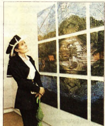
A biennalén

rozatának újabb fejezete „Jel, gesztus, érzélem” címmel.