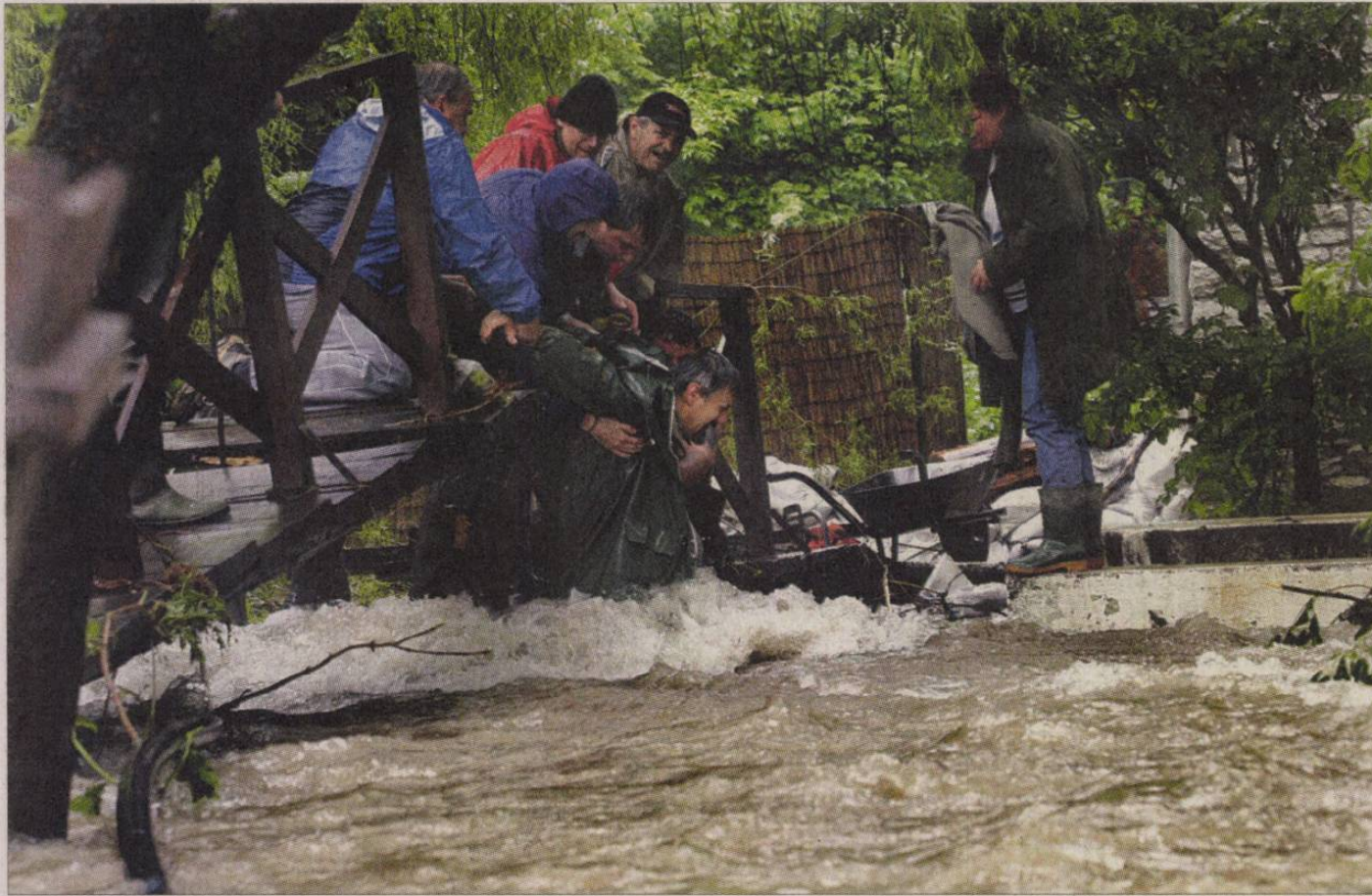
A lillafüredi pisztrángtelepnél embert és halat is elvitt a víz