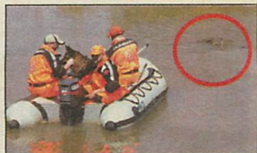
Hetekig sodródott a folyóban

Az I. Királyi Göreynyalázkodó május 13-án rendezik meg a diósgyőri várban. Az eseményre a Miskolci Vadászgörey Klub lelkes tagjai és görijeik mellett a budapestiek is ellátogatnak. A megjelenést tekintve reneszánszkort idéző ruhákban pompáznak majd a görök gazdijai, és minden érdeklődővel megismertetik a göreynyartás több száz éves múltját, és magukat a jópofa állatok is. A szervezők terveznek göreynyvárat is, melyben az állatkák vidáman játszhatnak majd.