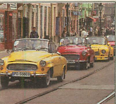
Veterán karaván a főutcában

MISKOLC. A csernobili atomkatasztrófa borzalmait bemutató, a rendszerváltozásig „szigorúan titkosnak” minősített dokumentumgyűjteményt most először tekinthették meg a miskolci érdeklődők vasárnap és hétfőn az MSZP miskolci székházában. A tárlat megdöbbentő fotói elénk tárják az igazi emberi tragédiát, és felhívják a figyelmet arra, milyen óvatosan kell bánni az atomenergiával.