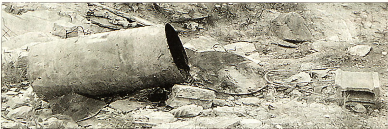
Ebben a hordóba találták meg az asszonyt, akit a vád szerint a férje ölt meg

Miskolc (ÉM – PT) – A Klapka György úton parkoló személyautót törték fel ismeretlen tettesek a minap Miskolcon. Miután bezúrták az ablakot, az utastérből a műszerfalba épített rádiós magnót kiszerelelték és elmenekültek a zsákmánnyal. A kár több tízezer forintba tehető.