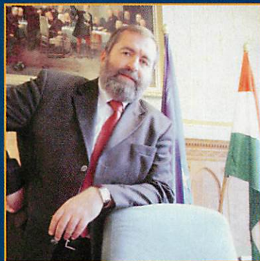
Mandur László, az országgyűlés alelnöke

Nekem a karácsony még mindig a szeretet és a családi együttlét boldog napjait jelenti. Mi négy generációban élünk együtt Pest melletti családi házunkban, így már szenteste is együtt van az apraja-nagyja. Másnap aztán a nagycsalád – több, mint húszan – együtt eszünk, iszunk, ajándékozunk, trécelünk és játszunk a kicsikkel. Ennél szebb karácsonyt nem is tudok elképzelni! Nagyon tudunk örülni egymásnak. Természetesen az ünnepi fogások csúcса a forró halászlé, s nem maradhat el a mákos, diós bejgli sem. A karácsonyi főzés az anyósom kiváltsága, hetvenöt évesen sem adná oda senkinek a fakanalat. De nem is kell, mert tényleg remekül főz. Az ünnepek alatt jobb, ha fel is fűggesztjük a fogyókúránkat, úgy sem tudunk ellenállni az illatoknak!