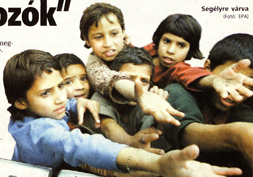
Segélyre várva