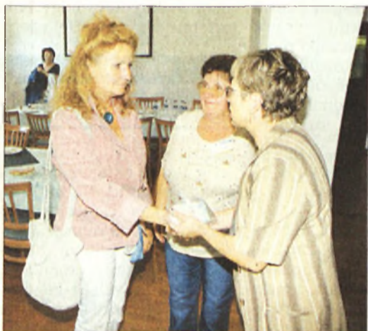
Kollégánk (balra) átveszi az összegyűjtött pénzt

Mint arról korábbi cikkünkben már beszámoltunk olvasóinknak, feljelentést tett a letartóztatott miskolci rendőrkapitányság kábítószeres ügyekkel foglalkozó alosztályvezetője azok ellen a vezető borsodi ügyészek ellen, akiknek elvileg a letartóztatását köszönheti. /4.