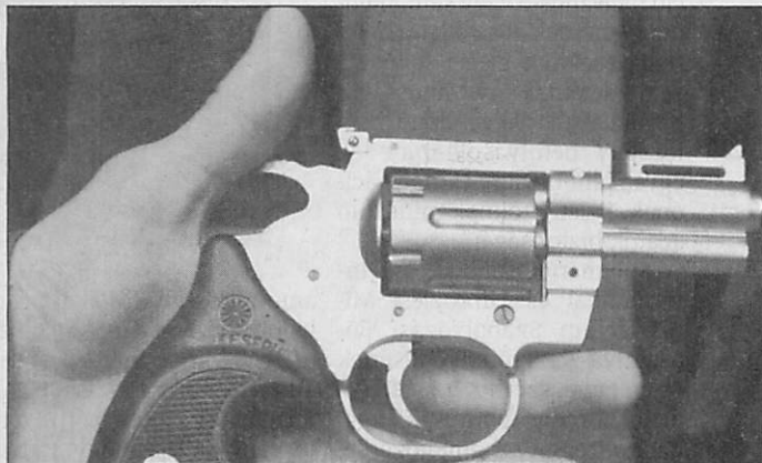
Egy lövés végzett az asszonnyal

Az eljárás több emberen elkövetett szándékos emberölés kísérlete miatt indult ellene. De mivel a rokonok nem voltak hajlandók vallomást tenni, csak a vádlott vallomására alapozta a bűnügyet a bíróság.