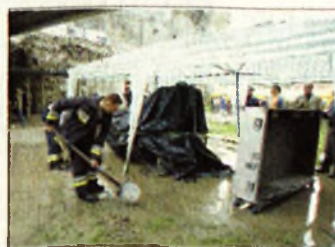
Segítség a várban

kapott hétvégi házhoz is. És segítettek benne, hogy a nagy eső miatt víz alatt álló részeket megtarthassák a Kaláka fesztivált a diósgyőri várban.