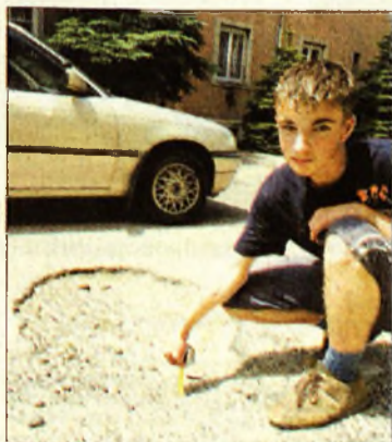
Kátyúból nincs hiány Miskolcon