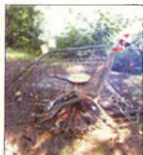
Ez lett belőle?

Bükkaranyos (ÉM - PT) – A Harsányi út mentén Bükkaranyos közelében lévő hétvégi házban találtak rá a földön mozdulatlanul fekvő férfira kedden délelőtt. A segélykérés után helyszínre érkező mentők azonban már csak a halál beálltát tudták megállapítani. Mint kiderült, egy miskolci illetőségű férfi vesztette életét, feltehetően természetes halállal. A forró nyomos izelkedés és a halottszemle során ugyanis bűncselekményre utaló adat vagy körülmény nem merült fel. A férfi halálának okát a boncolás során állapíthatják meg. A rendőrség államigazgatási eljárásban vizsgálja az eset körülményeit.