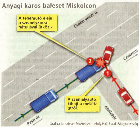
Grafika (a baleset feltételezett lefolyása) Észak-Magyarország