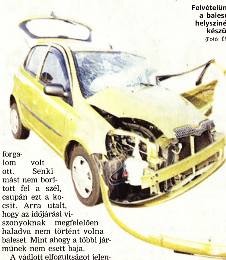
Felvételünk a baleset helyszínén készült

ESZAK www.boon.hu http://emtippek.boon.hu A KRESZ letölthető (DOC 448 kB)