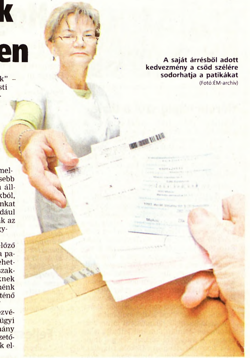
A saját árrésből adott kedvezmény a csőd szélére sodorhatja a patikákat

www.boon.hu http://hitek.boon.hu További híreket!