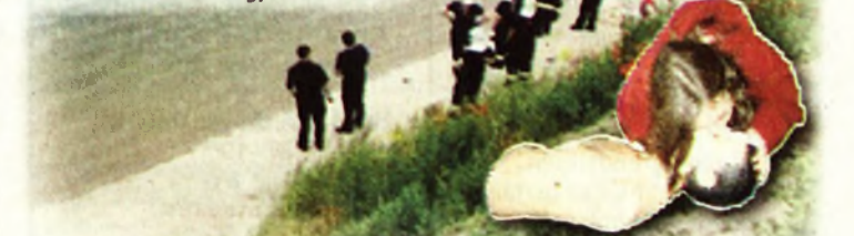
Grafika Észak-Magyarország