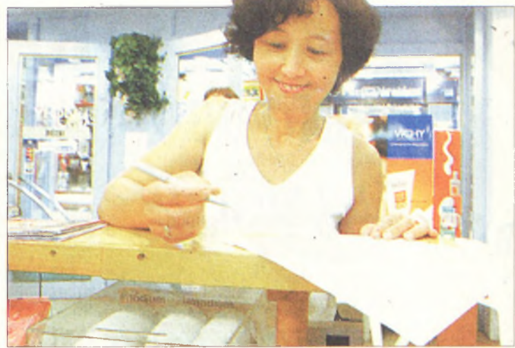
Sokan csatlakoztak már aláírásukkal a tiltakozókhoz

mind gazdasági, mind etikai szempontból elutasítják, s tiltakozó ellenlépésekről határoztak. Ennek jegyében a betegeket tájékoztató plakátokat helyeznek ki valamennyi gyógyszertárban, valamint aláíróleveket raknak ki, amelyekre hiteles aláírásokat várnak, bizonyítandó, hogy élvezik a lakosság támogatását.