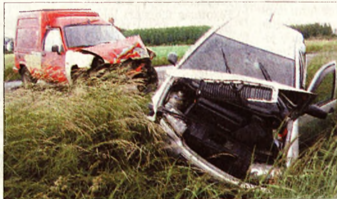
A baleset helyszínén

csütörtökön délelőtt. Úgy tudjuk, hogy hárman sérültek meg, köztük egy gyerek súlyosan, ezért őt kórházba szállították.