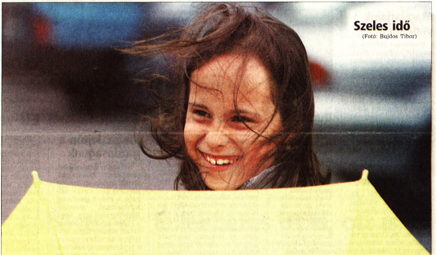
Szeles idő