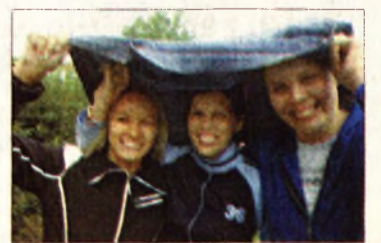
Esik és fúj a szél

ge amúgy is olyan feltételekkel szerződött a társasággal, hogy a közösség (megbízottja) kérése esetén indítja be, illetve állítja le a radiátorok melegítését a szolgáltató. Erre vonatkozó kérés tegnap délutáni érdeklődésünkig nem érkezett a céghez. A meteorológiai szolgálat helyi adatai