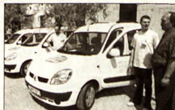
Az átadás pillanata

Grafika (a baleset feltételezett lefolyása) Észak-Magyarország