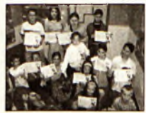
A nyertesek csoportja

Miskolc (ÉM) – Popper Péter pszichológus-íróval találkozhatott a közönség tegnap a II. Rákóczi Ferenc Megyei Könyvtárban. Az Ünnepi Könyvhét alkalmából rendezett találkozón az író a Kinyílt az ég? profán verseskötve kapcsán beszélgetett a közönséggel. Több vers és versrészlet mellett Popper Péter ezekhez fűződő érzései, gondolatai találhatók a könyvben.