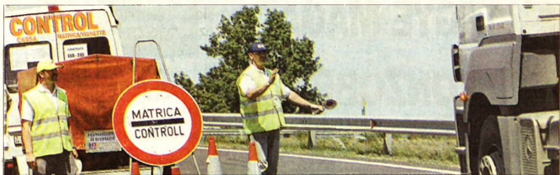
Az ellenőrzés tegnap is folyt

Miskolc (ÉM) – Június 1-jéhez képest csak néhány nappal később, valamikor a jövő hét elejétől használható díjmentesen az M30-as Coracsomópont és emődi leágazás közötti szakasza – tudtuk meg tegnap délután. Korábban Tóth Judit, a szaktarca szóvivője azt nyilatkozta lapunknak, hogy megszületett az ehhez szükséges rendelet módosítása, így nincs akadálya annak, hogy június 1-jétől ingyenes legyen az említett szak-