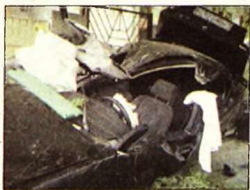
Csúnyán összetört

Miskolc (ÉM - PT) - Speciális vágószerszámok segítségével szabadították ki a tűzoltók a személyautóban rekedt utast hétfőn Miskolcon. A karambolban, ami a Lévay és Szilágyi utcák kereszteződésében történt, egy személy súlyosan, kettő könnyebben megsérült meg. A baji feltehetően az okozhatta, hogy valami miatt figyelmetlenül hajtott ki a már zöld sávon haladó kocsit elé egy személyautó. A súlyos sérült a valószínűleg baleset bekövetkezésével okolható járműben ült. Abban az autóban, aminek a karosszériája összeroncolt, amikor az összeütközést követően az út menti fának és kerítésnek csapódott. A baleset körülményeit a rendőrség vizsgálja.