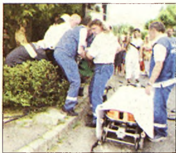
A mentők a helyszínen

● Meglett a Trabant. A Szentpéteri kapuban parkoló Trabant típusú személyautót nyom nélkül kötötték el ismeretlen elkövetők nemrég Miskolcon, de a lopást követő harmadik napon a rendőrök megtalálták az eltűnt kocsit, amit a rendőrség telephelyére szállítottak be.