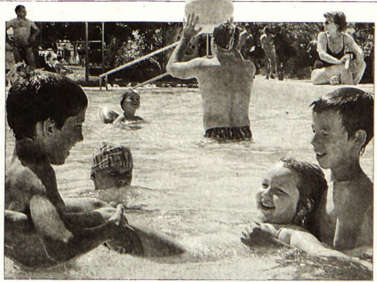
Miskolcon csak egy strand üzemel