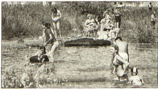
Csak ott szabad fürdeni, ahol ezt nem tiltják