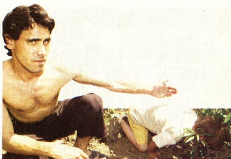
Igy feküdt a vaddisznótúrásban az eltűnt kicsi

Lapunk munkatársa a még láthatóan feszült apukával kiment a tetthelyre. Oda, ahol az „elcsavargott” gyerek éjszakára álmra szenderedett. Márkó, aki az eltűnés napján