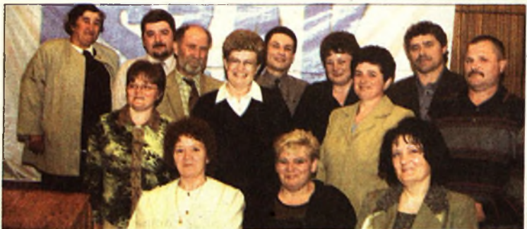
Ők azok, akik jutalmat kaptak kiemelkedő munkájukért

Az ünnepi vacsorát zene és tánc követte. Az est fénypontja a lapunk és társulóságaink lapfejével stilizált torták voltak, amelyeket ünnepélyes körülmények között szegtek meg és aztán fogyasztottak el közösen az est résztvevői.