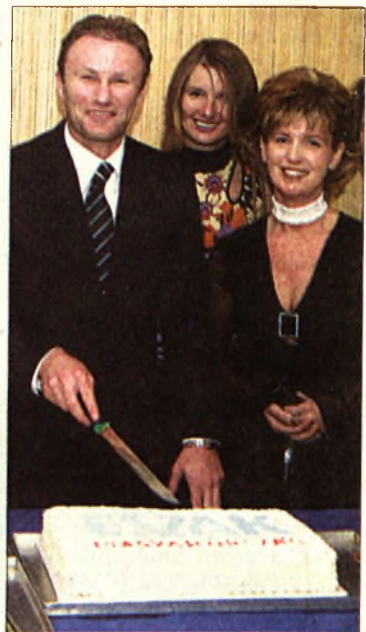
Megszegték a tortát