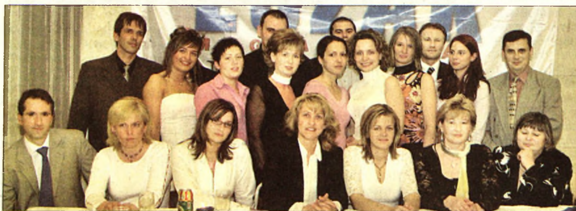
Az Észak-Magyarország lapterjesztőinek népes csapata