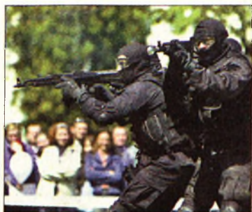
Látványos volt a bemutató

● Kámforrá vált autó. Négymillió forint kárt okozott az alkalmi tolvaj annak a budapesti cégnek, amelynek a miskolci Árpád utcában leparkolt értékes gépkocsiját nyomtalanul elkötötte nemrég. A jármű kézre kerítése érdekében körözést adtak ki járművel kapcsolatban.