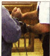
Kattant a bilincs (illusztráció)

A nyomozó hatóság azt is vizsgálja, hogy más hasonló bűncselekmények elkövetésével összefüggésbe hozhatók-e a most lebukott sínfelszedő csapat tagjai.