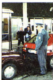
Átkelőn (illusztráció)