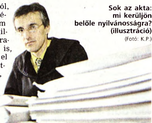
Sok az akta: mi kerüljön belőle nyilvánosságra? (illusztráció)

iránymutatás arról, hogy milyen személyes adatok nem szerepelhetnek a nyilvánosságra kerülő iratokban. Kérdés az is, hogy kik készítsék el ezeket a „internet-kész” anyagokat, hiszen például