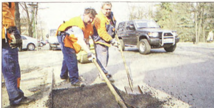
Munkában a kátyúzók