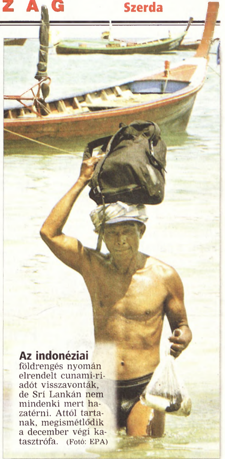
Az indonéziai földrengés nyomán elrendelt cunami-riadót visszavonták, de Sri Lankán nem mindenki mert hazatérni. Attól tartanak, megismétlődik a december végi katasztrófa.

www.boon.hu http://hirek.boon.hu További hírek!