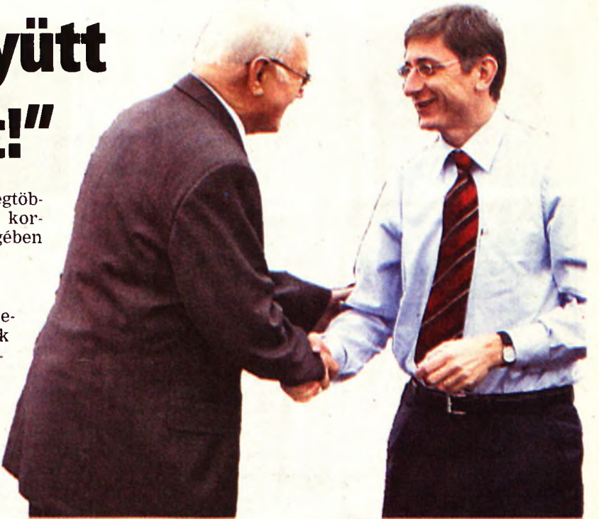
Gyurcsány Ferenc kormányfőt Besenyei Lajos rektor fogadta az egyetemen

A miniszterelnök kijelentette: ennek a világnak vége, csak az a Magyarország lehet sikeres, ahol a teljesítmény, a verseny áll a középpontban és nem az állam mindenhatónak hitt segítsége. Természetesen a piac sem tud mindent megoldani, ahogy az állam sem, éppen az a kormány feladata, hogy a kettő között megtalálja a helyes egyensúlyt. Az ország sikeres megújítása attól is függ, hogy a társadalom hajlandó-e visszavenni a közügyek gyakorlását vagy továbbra is rá-