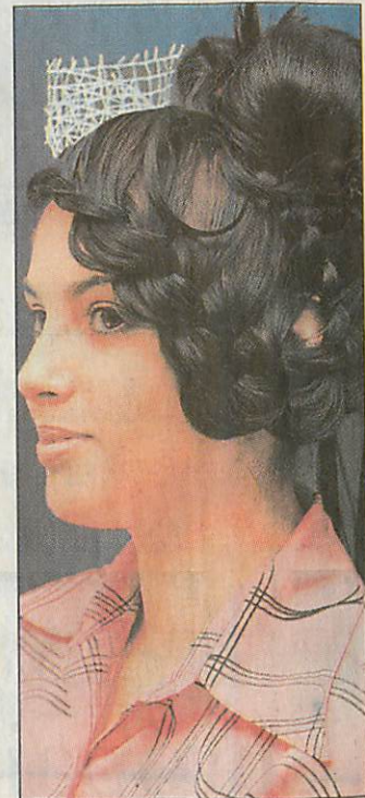
Harmadik alkalommal rendezik meg az egész napos programot

Ezúttal a korábbiaknál nagyobb hangsúlyt fektetnek a kísérő programokra: a szakmai kiállítás, vásár és bemutató mellett ingyenes sminktanácsadással, haj- és fejbőrdiagnosztikával, számítógépes frizuratervezéssel, manikűr-, műköröm tanácsadással, körömlakkozással, kozmetikai gépi bőrdiagnosztikával, ultrahangos hajhosszabbítással, hajdúsítással várják az érdeklődőket. Fontos megjegyezni, hogy az említett lehetőségeket díjmentesen lehet igénybe venni.