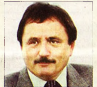
Kovács Tibor országgyűlési képviselő