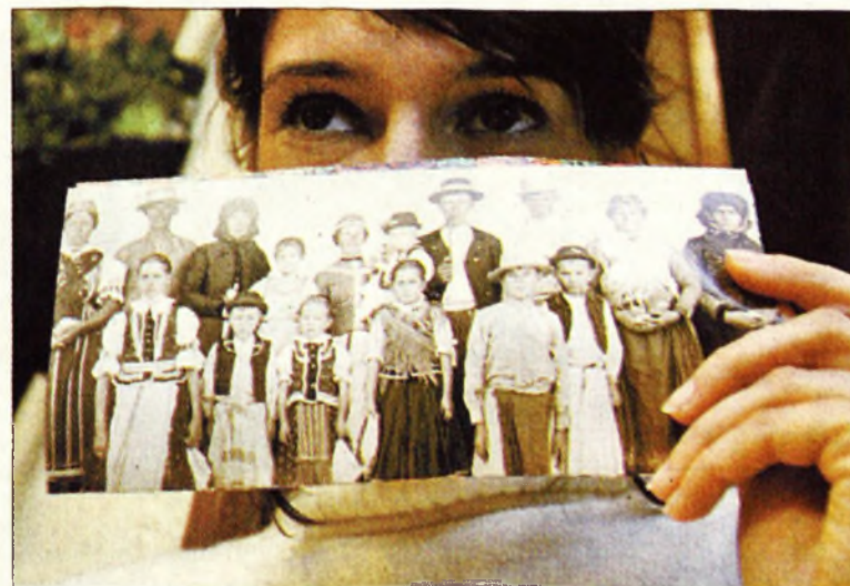
A kincsestár egy darabja a Lézerpont Stúdióban