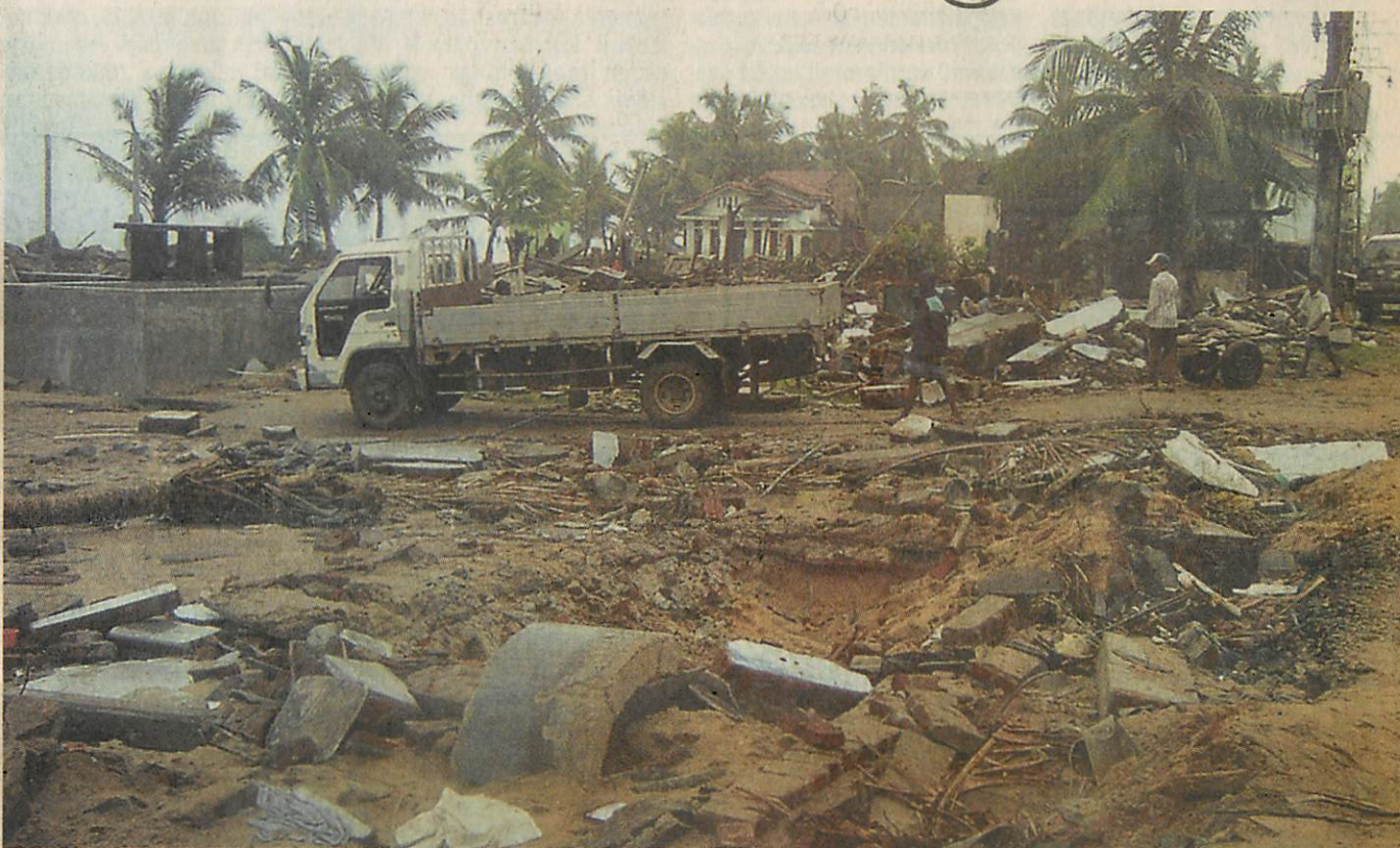
A vízözön előtt csodálatos volt erre felé a táj, s házak sora állt itt, ahol most a törmelékot takarítják a túlélők