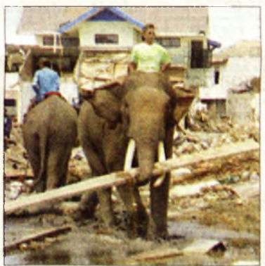
Még mindig a romeltakarításnál tartanak

Közben persze a munkát sem hanyagolták el a magyar orvosok. Szombaton három műtétet végez-