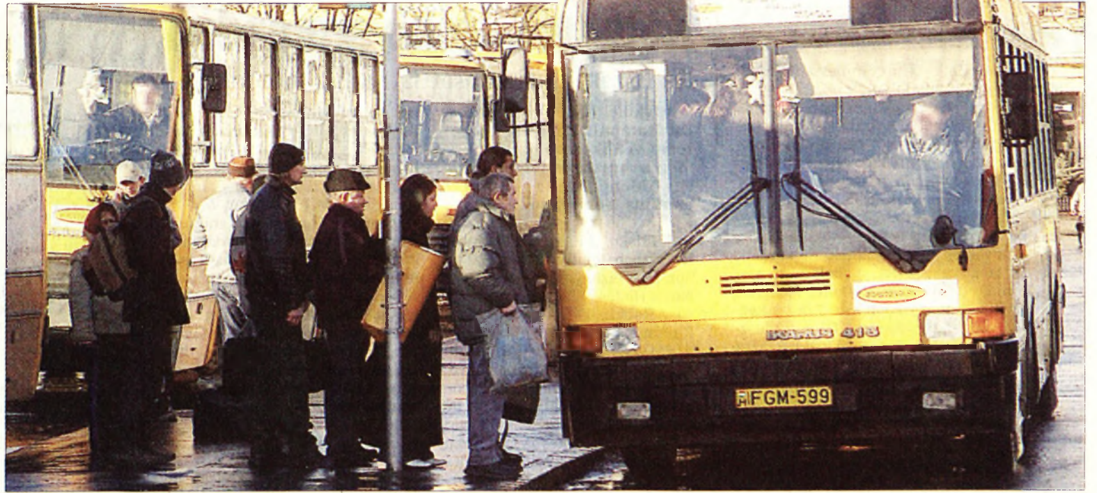
Hétfőn reggel sztrájkolnak a Volánnál – a dolgozók a bérkövetelésüket szeretnék nyomatékositani (illusztráció)