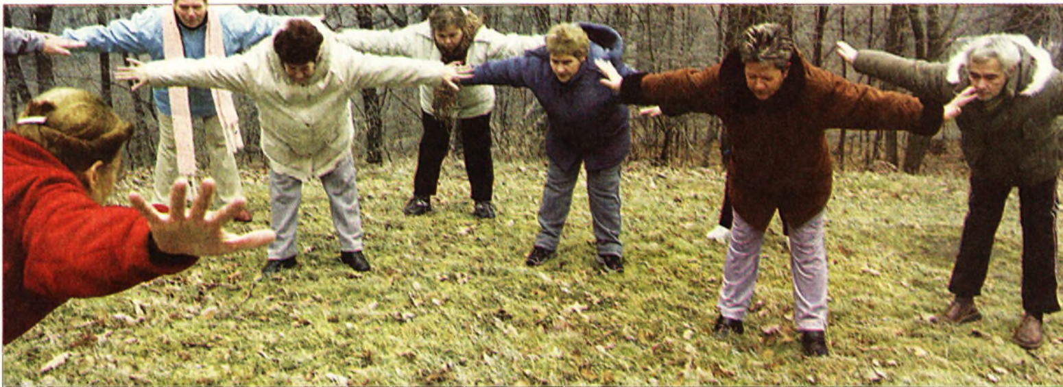
Dohányozni nem muszáj – a leszokást segítik a különféle, szabadban végezhető tréningek és gyakorlatok (illusztráció)