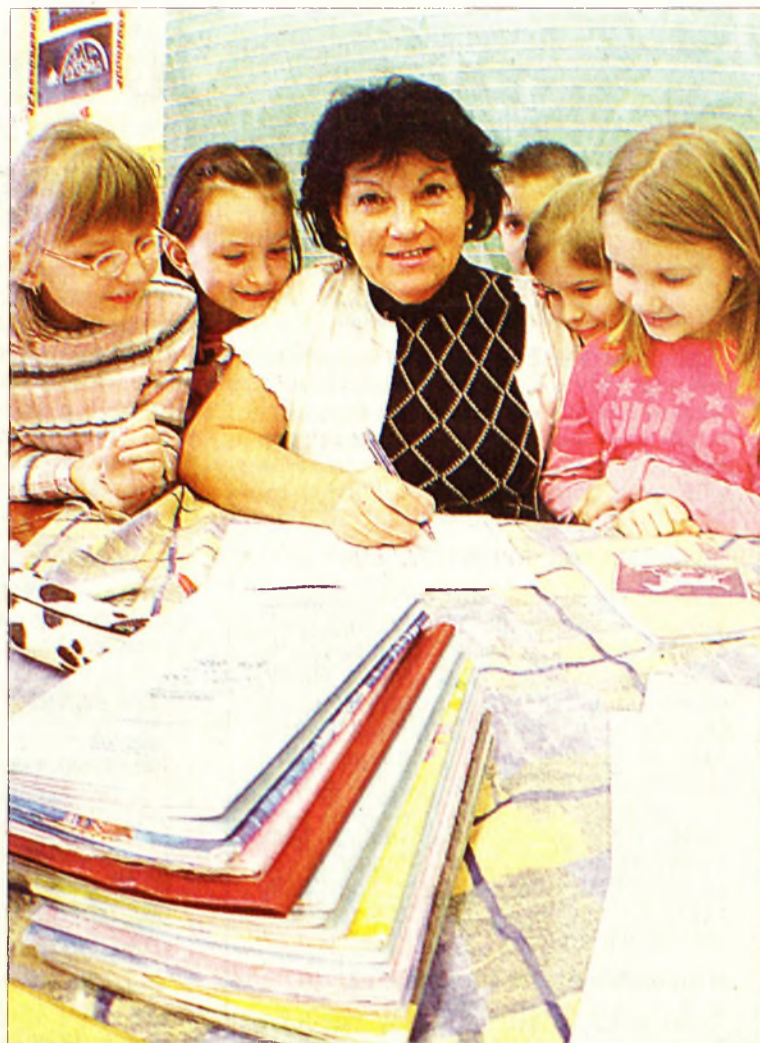
Megbecsülést érdemelve (Illusztráció)

kat, akik január 1-jén már nem voltak állományban. A 13. havi juttatás azért volt kedvezőbb, mert amelyik intézmény rendel-