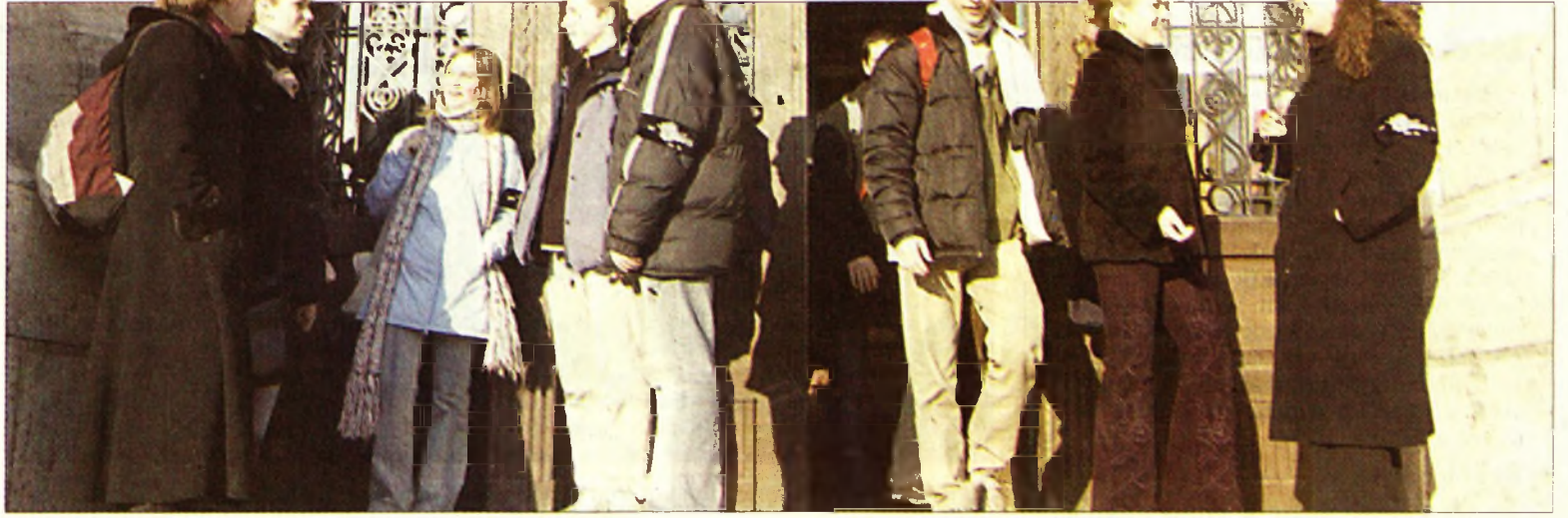
A hatodik helyen álló gimnázium kapujában

☑ Tűzoltó véradók. A Hivatásos Tűzoltók Független Szakszervezete országos véradó akciót hirdetett meg a hivatásos tűzoltók számára január 18-tól 20-ig. A mottó: Ha úgy gondold, havonta 240 óra szolgálat nyolcvanezer forintért nem megbecsülés egy tűzoltó számára, akkor adj vért a tűzoltókéért!