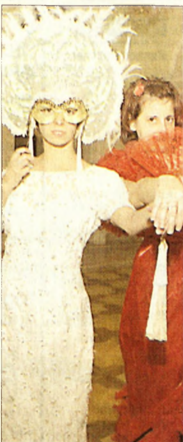
A szép ruhák idősza következik

Ennek folytatásaként írták alá a 2005-2006 évekre vonatkozó szándéknyilatkozatot. „Bízva abban, hogy Románia 2007-től az Európai Unió teljes jogú tagjává válik, együttműködünk annak érdekében, hogy Hargita megye minél eredményesebben és érdemben felkészülhessen a csatlakozásra” – tartalmazza a dokumentum. Az együttműködés konkrét területeiként a gyermekvédelmet, a közoktatást, a minőségbiztosítást, az idegenforgalmat és a gazdasági életet jelölték meg – a kölcsönös előnyök alapján.