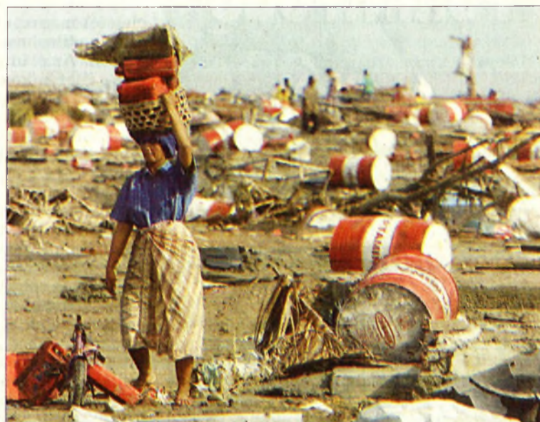
A pusztítás még mindig felmérhetetlen

– Ez inkább csak háziiorvosi jellegű munkát jelent, a komolyabb ellátást igénylő sérülteket