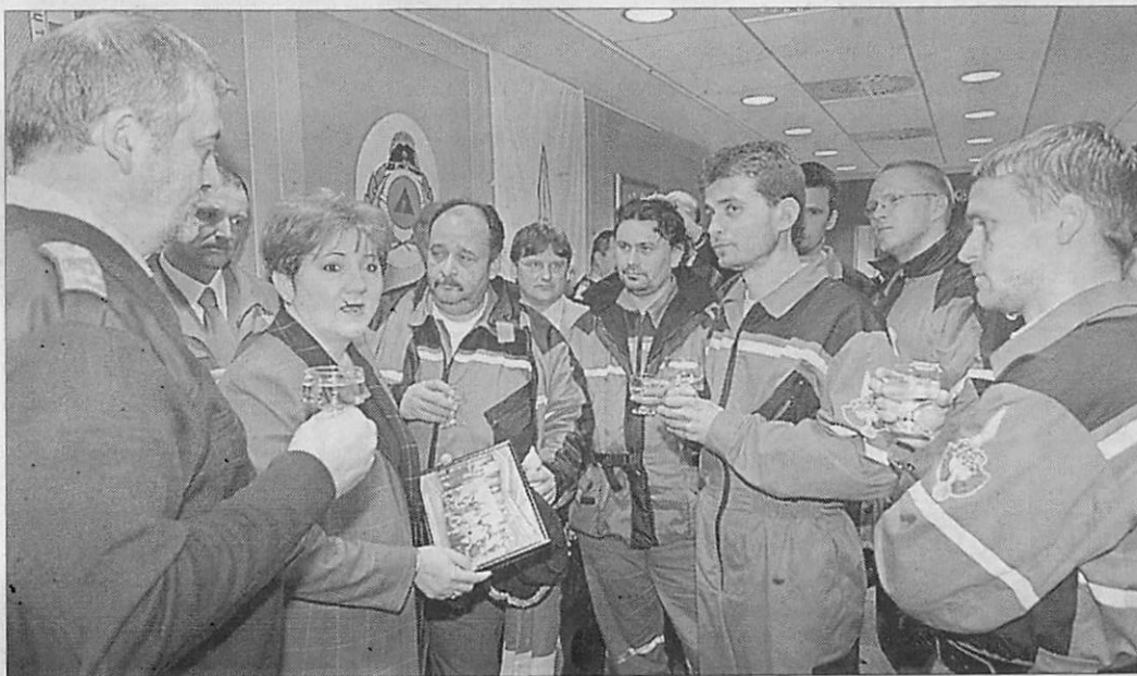
Lamperth Mónika belügyminiszter Ferihegyen a szombaton visszatért magyar orvoscsoporthoz tagjaival

A Délkelet-Ázsiában karácsony másnapján bekövetkezett természeti katasztrófa áldozatainak száma napról napra tovább emelkedik. Jakartában szombaton hivatalosan bejelentették, hogy péntek óta további 3000 holttestre bukkantak, és ezzel az áldozatok száma Indonéziában 104 055-re emelkedett. Mintegy tízezer embert változatlanul eltűntként tartanak nyilván. Az indonéziai adatokkal együtt az elhunytak száma 156 108.