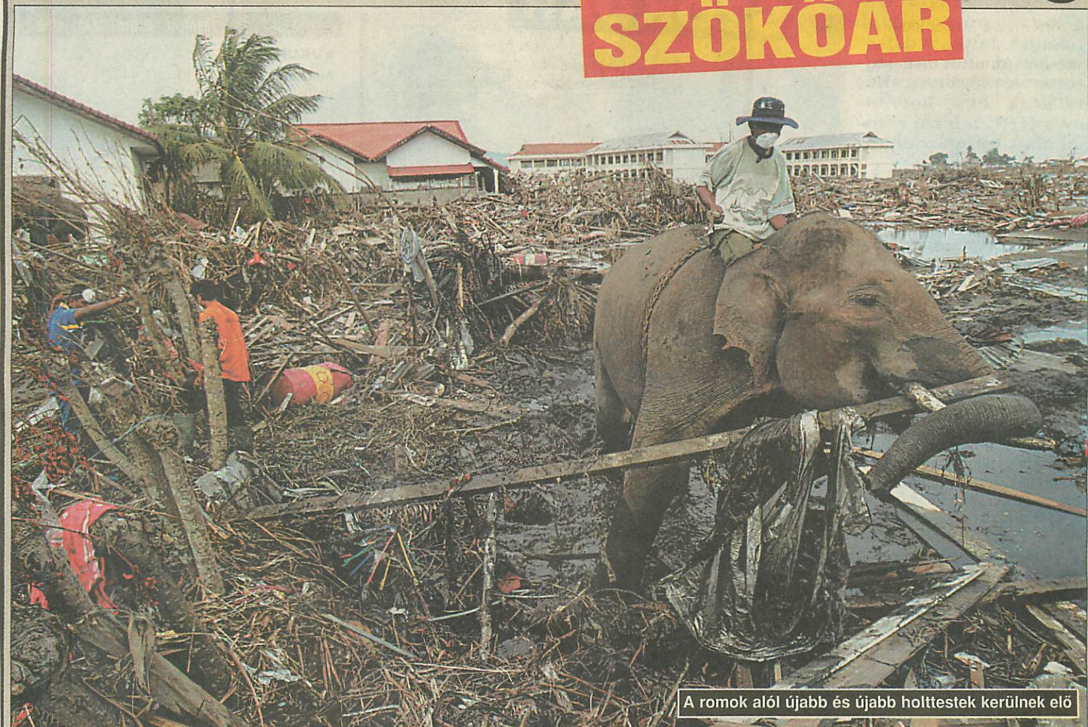
A romok alól újabb és újabb holttestek kerülnek elő

A legfrissebb adat szerint egyedül Indonéziában 101 ezer 318 ember vesztette életét a december 26-ai délkelet-ázsiai természeti csapásban. Összesen így hozzávetőlegesen 163 ezerre nőtt az áldozatok száma. A segélyszállítmányok ugyan folyamatosak, de nem mindig jutnak el a megfelelő helyre. A legegésztőbb szükségét továbbra is a tiszta ivóvíz jelenti.