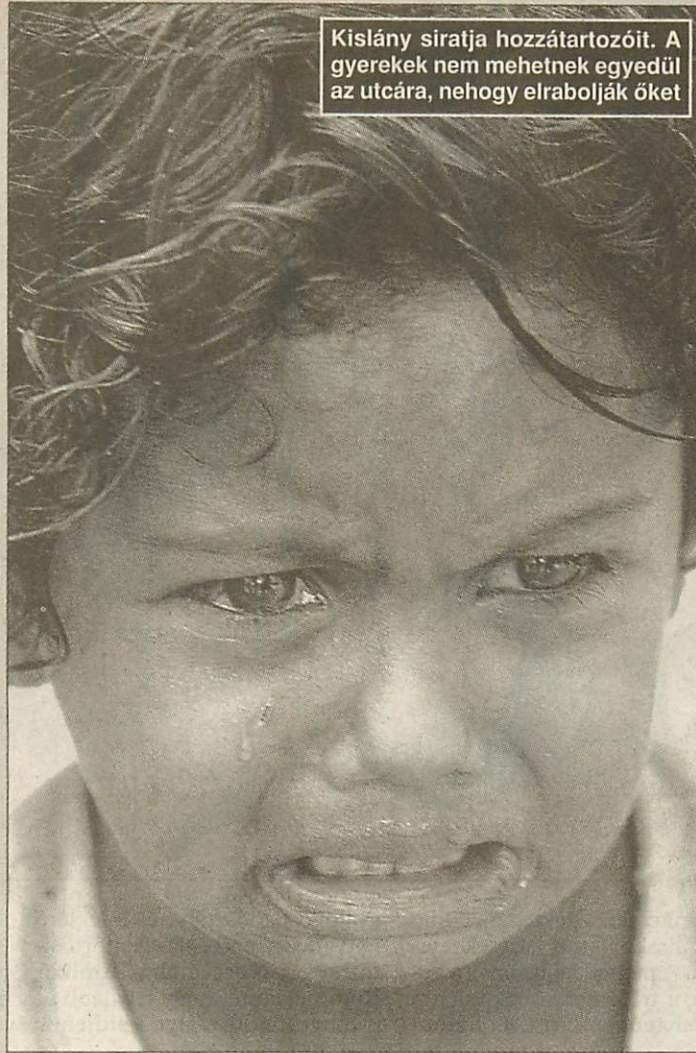
Kislány siratja hozzátartozóit. A gyerekek nem mehetnek egyedül az utcára, nehogy elrabolják őket